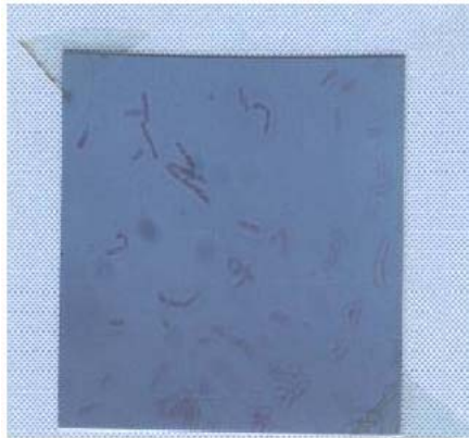
Gambar 2. Desulfobacter curvatus